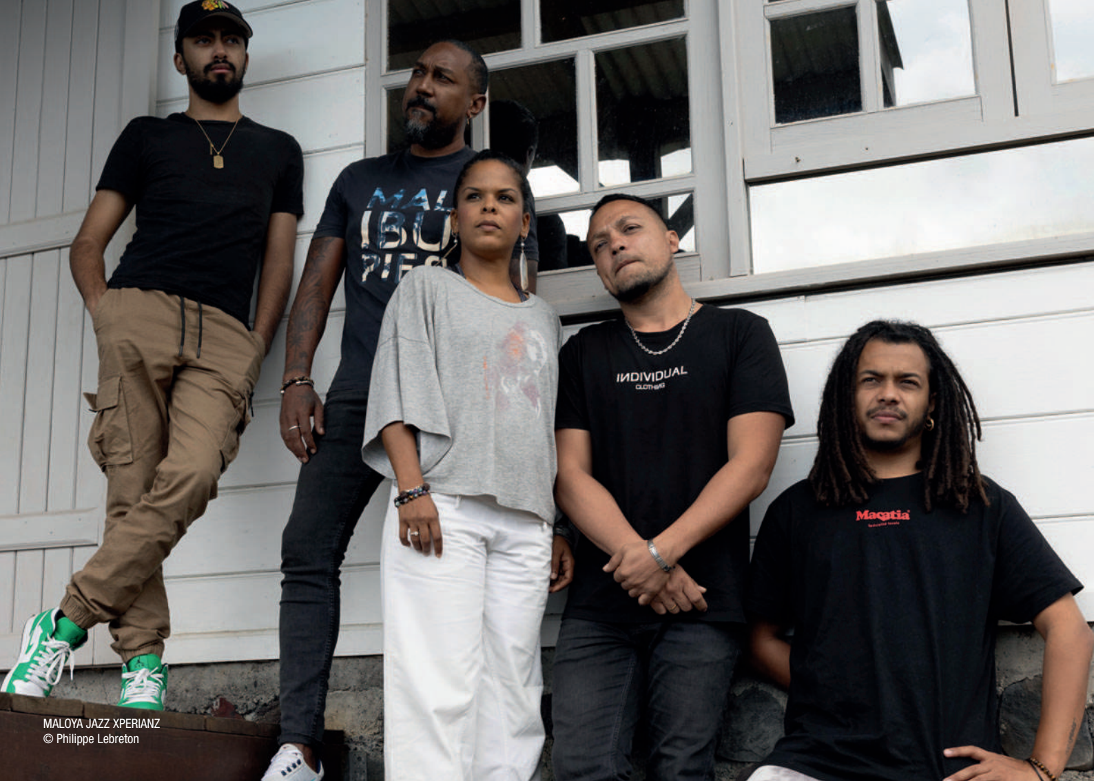
MALOYA JAZZ XPERIANZ